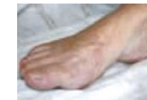
Ergebnis nach komplexer Vorfuß-Operation