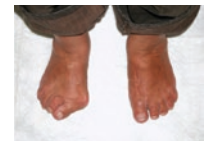
Spreizfuß mit Hallux valgus und Hammerzehen